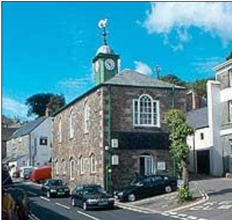
Gorsedd Kernow a vydh synsys an vlydhen ma yn Ryskammel ( Camelford ) dhe'n kynsa Sadorn a vis-Gwynngala. Ottomma skeusenn an lyverva y'n dre.