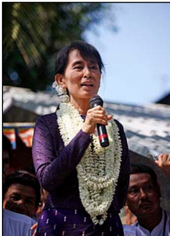
Aung San Suu Kyi ow kewsel orth hy skoedhoryon

Y'n prys na, Aung San Suu Kyi, hembrenkyades an NLD ( National League for Democracy ): Kesunyans Kenedhlek a-barth Demokratieth) o hwath prisonys yn chi. Hi re bia prisonys wostalleth yn 1989.