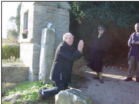
Ronan ow pysi war y dhewlin

Mes yma leow erell yn Breten Vyghan sekrys war-lergh Sen Pyran po war-lergh syns erell a Gernow a vynnyn diskudha hwath, martesen war-barth genowgh ?