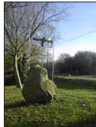
Men-kov kas Kergidu