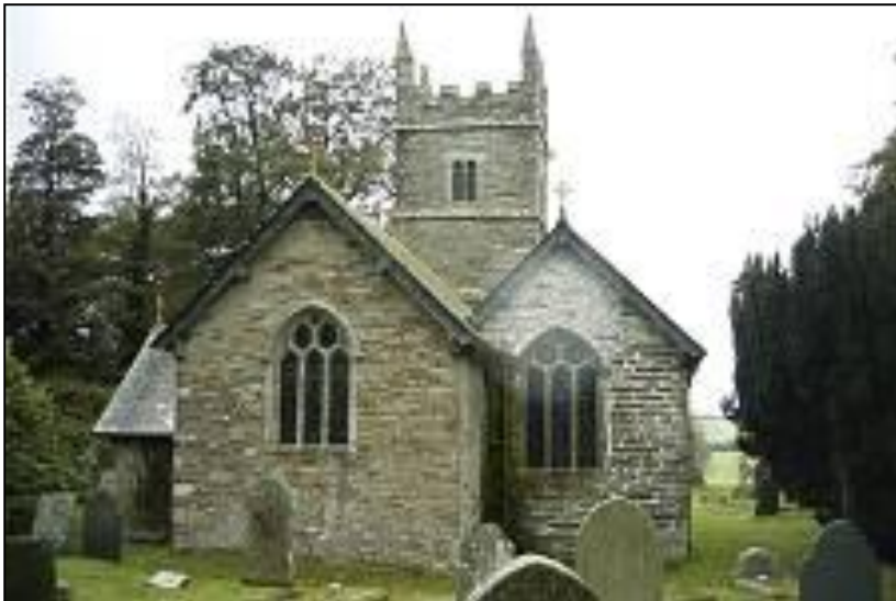
Eglos Sen Keyn. An dre a vydh kevys war an fordh ynter Lyskerrys ha Logh.