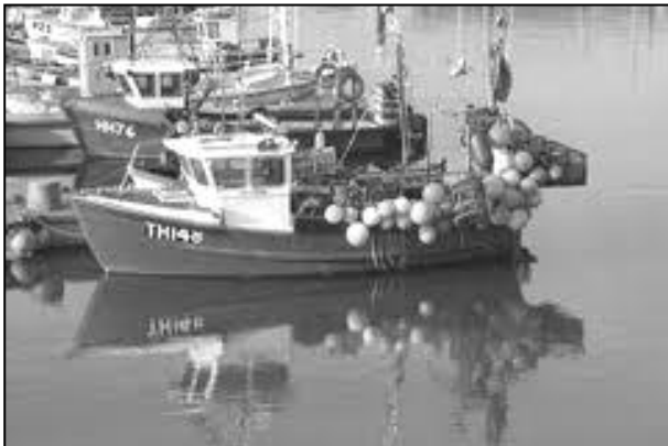
kokynnow le es 10 meter

koweth, pub huni anedha. Ynwedh, brassa niver an kokow aga honan a's teves marwoestlow euthyk bras kelmys dhedha, ha dyghtyer an arghantti yw 'esel anweladow' an mayni. Dhe'n mayniow ma dres Breten Veur oll yma mysterlu nowydh henwys NUTFA ( New Under Ten Fishermen's Association , Kowethas Nowydh Pyskadoryon Yn-Dann Dheg, ow styrya kokow le es deg meter aga hirder).