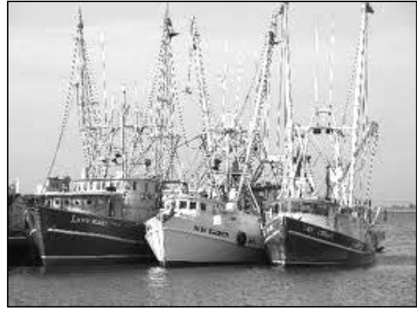
kokow hirra es 10 meter

gans hirder le es 10m, mes dhe'n 1,388 eth 96% an kach ha dhe'n 5,056 eth an 4% arall 1 .