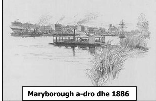
Maryborough a-dro dhe 1886