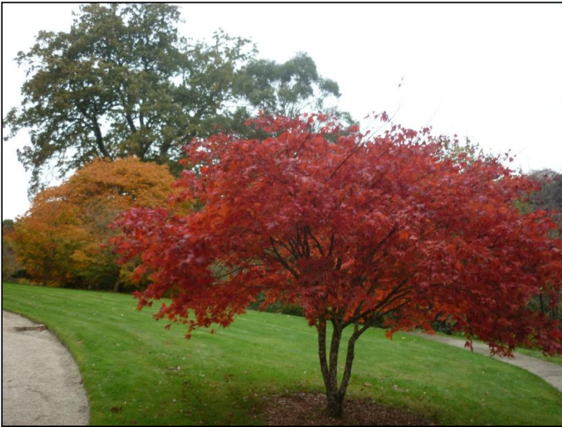
Lowarth Treleesyek, mis-Du 2013, ha'n delow treylya aga liw kyns koedha.