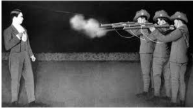
Harry Houdini ow kul an hus 'kachya pellenn'