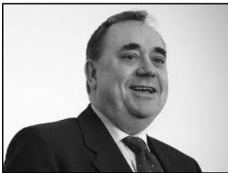
Alex Salmond, hembrenkyas an SNP

Gorhemmynn an referendum a dheu a'n werin albanek wosa etholans 2011 Pàrlamaid na h-Alba (Senedh an Alban). An parti SNP (Parti Kenedhlek Albanek) a waynyas 69 a'n 129 esedhva hag o kavadow y'n vlydhen na, ha gans an trygh na a waynyas ynwedh an awtorita rag gorra a-rag tus Alban govynn kresel aga manifesto, henn yw: 'A dalvia bos Alban kenedhel anserghek?' Wostalleth yth o an govynn tamm hirra: 'Owgh hwi unnver y talvia bos Alban kenedhel anserghek?' Mes krodhvolas a wrug Governans Westminster yn kever an lavar na ynn unn leverel bos anresnadow an geryow 'Owgh hwi unnver ...?' rag y hwrussa ynnia dhe dus gothybi 'Ya, unnver on.'