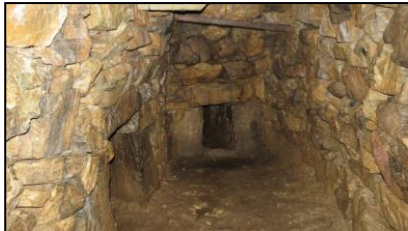
gwel a-ji dhe fogou Helygi

Wosa ow vyaj dhe an annown yth esa gorheras leys war ow dillasow!