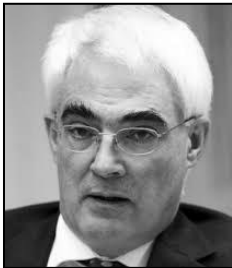
Alistair Darling, kyns Chansler an governans Lavur, erbynn.