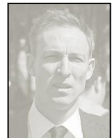
Jim Murphy, hembrenkyas Lavur Alban mis-Me 2015

Jim Murphy (ha ganso an les-henwyn 'Skeletor', 'Arghpedrean', 'Creepy Jim' ha 'Zombie') gans y is-hembrynkyades Kezia Dugdale ('Deputy Dug') re sywyas Johann Lamont, mes deray ha blam yma hwath yn 'unnses-akontieth' albanek an parti. Dell welir gans lies huni yn Alban, Lavur re waynyas an Unyans (gromers the Gordon Brown ha'n 'Ambos') mes i re gollas Alban yn unn wul yndella.