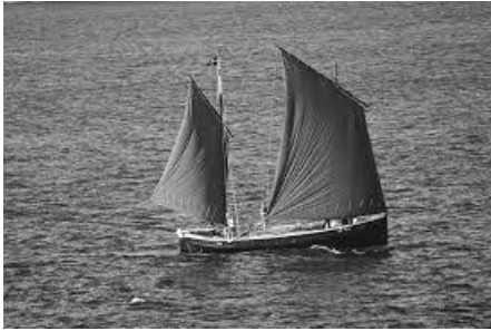
An kok kernewek Barnabus

wrussyn gortos pell yn Shetland ha ni a woelyas dres an nos dhe Kirkwall yn Orkney ow kul devnydh agan skentoletth woelya nosweyth rag goelya dhe ynysow Orkney. Ni- a woelyas adro Orkney nebes dydhyow kyns deweles dhe Wick. My a gemmeras an tren tre a-dhiworth Wick mes an Barnabas a besyas gans mayni nowydh dhe'n dyghow ow mos dhe Arbroath, Hartlepool, Holy Island ha Whitby ow tehweles dhe Gernow dalleteh mis Gwynngala kepar ha'n lestri pyskessa koth nans yw kans ha hanterkans blydhen.