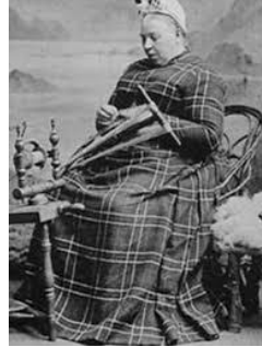
Maria Veur an Kanow

Mes an vardhes albanek an moyha meurgerys yw Màiri Mhòr nan Òrain ('Maria Veur an Kanow'), Mary MacPherson, 1821-98), hag a skrifas 'kanow-protest' a'y dydhyow hy.