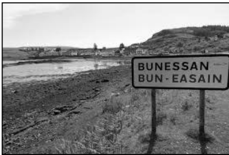
Ilow an karol yw henwys 'Bunessan'