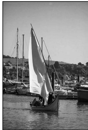
devedhyans ha'n skath hag ynni an 'Epskop'