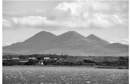
gwelyow a'n ynysow

(ynys an ywin), mes nebonan a gammredyas ioua avel iona , hag ottena dallesh an hanow arnowydh. Islay yw Ìle (leverys i-luh) yn Gàidhlig. Yma lies gwrier hwyski yn Islay. Lismore (Lios Mor) a styr lowarth meur, ha pur deg ha feyth yw an ynys ma yn hwir. Muck yw Eilean nam Muc, po Ynys an Mogh, kevys yn Sowsnek a'n Oesow Kres avel Swynes Ile. War unn mappa koth yth yw skrifys Eilean nam Muc-mhara, hag a styr Ynys an Morviles.