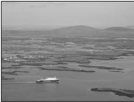
po devedhyans war vor

Yth yw an Hebrides, po na Innse Gall, ynysek aswonnys ha meurgerys fest yn ta dres oll an bys. Ni a wra agan omrekna pur feusik bos trigys yn tyller mar deg, mar dhidheurek ha mar gowethek. Ha, heb mar, yth yw agan ynys vunys ni, Ynys Seil, an t-Eilean Saoileach, an gwella ynys oll yn na Innse Gall.