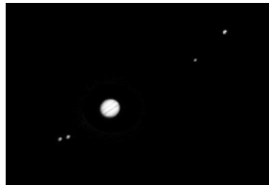
moy dhe dhos y’n mis a dheu ...

Mars eus kavadow pellwelell vyghan po diwlagattell grev, y hyllir sywya an leow dyffrans pub nos an peder loer Jovyn (Europa, Io, Callisto ha Ganymede). Yth yw meur dhe les dhe dhallather yn steronieth gweles aga leow dhe janjya. A-woeles yw skeusenn dipek a’n pyth yw gwelys.