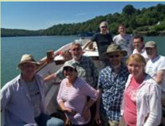
Skeusenn: Yeth an Werin, Truru

Kuntelles nowydh Yeth an Werin yw restrys y'n diwotti The Handpost Hotel , Casnewydd (Newport), Kembra, pub nessa Meurth a'n mis ynter 7 ha 9 eur. Pella derivadow diworth: Justin Eager, 07982 737665, iceblue1066@hotmail.com