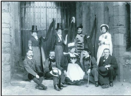
Skeseunn a-dhiworth an Kuntelles Keltek y'n vlydhen 1904.