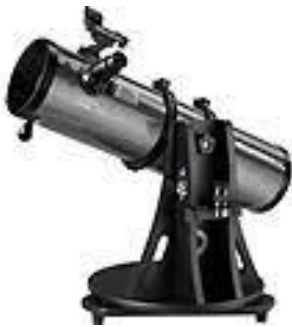
pellwelell sempel 150mm

Y hyllir kavoes pellwelell vyghan da hag a wra diskwedhes yn kler kowdell war an Loer, bondys ha’n loeryow a Jovynn, ha Sadorn gans y gylghyow rag £250 - £350. Homma a vydh pellwelell a 150mm (treusvudur an mirour) Mes y koedh bos avis kevys kyns prena pellwelell, ha my a vydh lowen dhe wul henna.