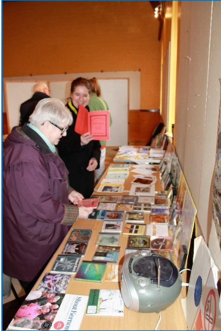
diskwedhyans lyvrow hag ilow