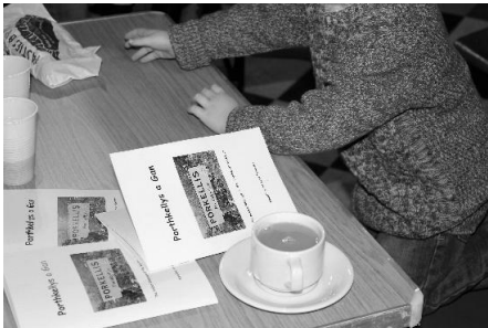
An lyvrigow ‘Porthkellys a Gan’ ha koffi da!