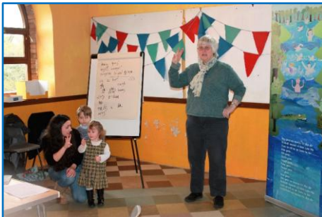
Loveday Jenkin owth hembronk an esedhek