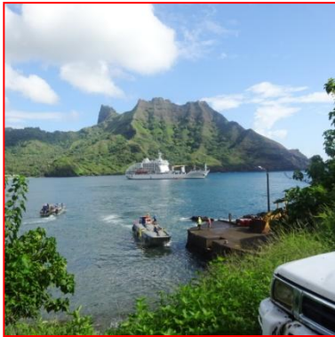
An gorhel Aranui 5 gans skath hir rag tira