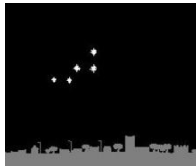
An Ranneves Cassiopei

Hwilewgh neppyth y’n ebron north-east - Cassiopeia - parys rag an mis a dheu. Hwi a wra gweles prag!