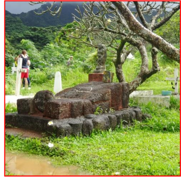
Men-bedh Paul Gauguin, Atuona, Hiva Oa