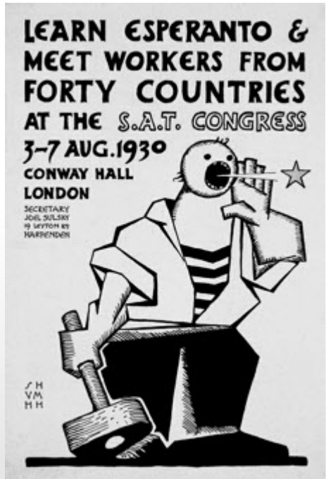
ARWOEDH a-barth Esperanto.

Dynnargh, a hendasow, ragowgh re bassys an eur... Kemmerewgh kolonn, ow breder a bup liw, an miraj-dermyn hag a wrug agan skattra yn dhiguv a wra agan dasgesunya! Y'n eur ma, yn wann, yn dhall, dos a wren, mos a wren, kevrennow yn kadon na wren formya ha na wren gweles: Kemmerewgh kolonn ha strivewgh!