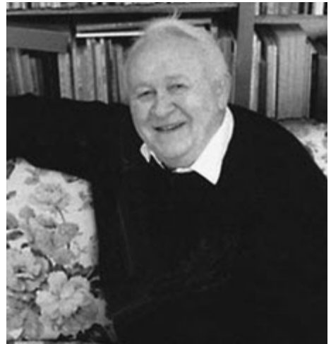
WILLIAM 'Bill' Auld (1924–2006).

Bill Auld a veu genys dhe Erith yn Pow Sows yn 1924, mes y gerens albanek a