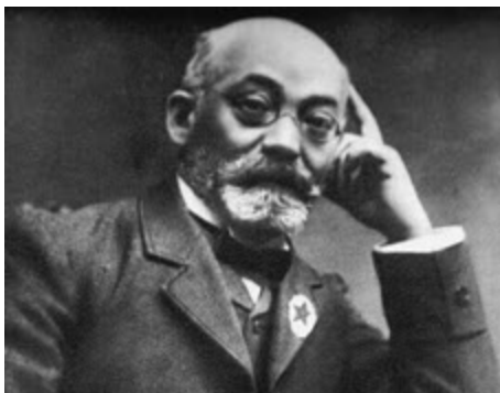
LUDWIK Lejzer Zamenhof (1859-1917).

Y gynsa lyver bardhonek yn Esperanto, henwys Spiro de l'Pasio ( Anall an Passhyon ), a veu dyllys yn 1952. Yn 1956, y hwrug skrifa y bennobereth La Infana Raso ( An Agh Fleghigyow ), bardhonek na veu mes a brynt a-dhia an vlydhen na. Ev o pennskriker lies lyver-termyn keswlasek Esperanto, y'ga