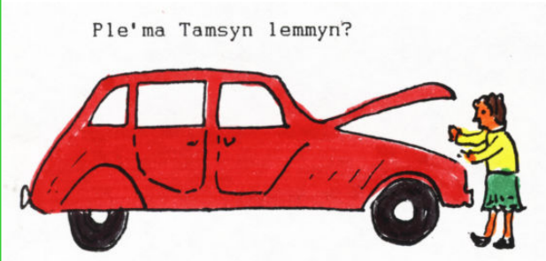
Yma hi, arag an karr. Nyns yw hi lowen lemmyn. Serrys yw hi.