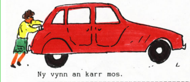
Ny vynn an karr mos.

Yma Tamsyn ow mos dhe'n dre. Res yw dhedhi prena kig ha losow. Pur lowen yw hi, yma hi ow kana. Da yw gans Tamsyn mos dhe'n dre. Martesen hi a wra dos erbynn onan a'y howetha ena. Yma Tamsyn ow lywya hy harr a-hys an fordh.